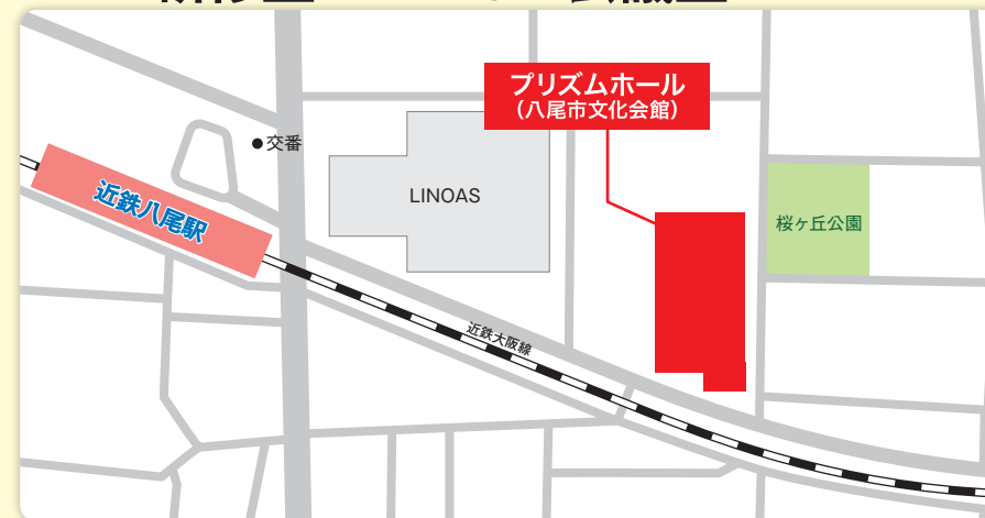
●八尾市光町2丁目40 ●近鉄大阪線「近鉄八尾駅」から徒歩5分

プリズムホール(八尾市文化会館) 27(金) 研修室(4階) 29(日) 会議室1(4階)